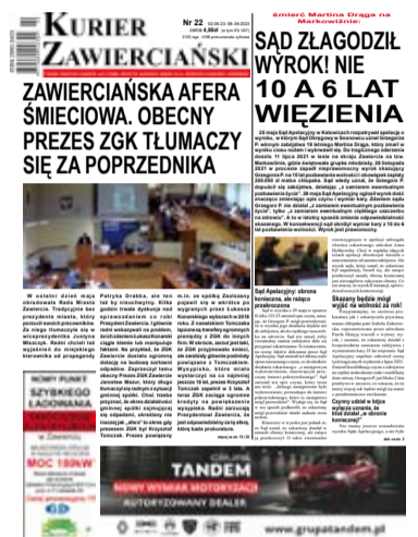
Artykuł ukazał się w numerze 22/2023r. Kuriera Zawierciańskiego. Data wydania 02.06.2023r.