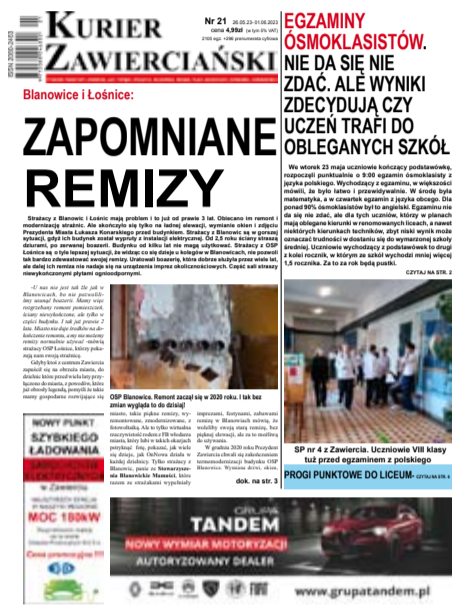
Artykuł ukazał się w numerze 21/2023r. Kuriera Zawierciańskiego data emisji 26.05.23r.

(26.05.2024r.) Strażacy z Blanowic i Łośnic mają problem i to już od prawie 3 lat. Obiecано im remont i modernizację strażnic. Ale skończyło się tylko na ładnej elewacji, wymianie okien i zdjęciu Prezydenta Miasta Łukasza Konarskiego przed budynkiem. Strażacy z Blanowic są w gorszej sytuacji, gdyż ich budynek został wypruty z instalacji elektrycznej. Od 2,5 roku ściany straszą dziurami, po zerwanej boazerii. Budynek od kilku lat nie mogą użytkować. Strażacy z OSP Łośnice są o tyle lepszej sytuacji, że widząc co się dzieje u kolegów w Blanowicach, nie pozwolili tak bardzo zdewastować swojej remizy. Uratowali boazerię, która dobrze służyła przez wiele lat, ale dalej ich remiza nie nadaje się na urządzenia imprez okolicznościowych. Część sali straszy niewykończonymi płytami ognioodpornymi.