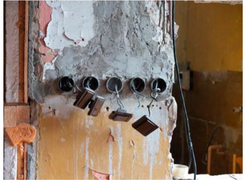
OSP Blanowice. Remont zaczął się w 2020 roku.

Radni dwa razy przyznawali pieniądze na dokończenie remontu, które gdzieś zniknęły. Remont utknął, nic się nie dzieje. Dobry gospodarz by tak nie robił, że rozgrzebie remont, zrobi sobie zdjęcie i zostawi nas z tym wszystkim. Skoro nie zaplanowano środków na remont całości, to powinno się tego w ogóle nie robić, albo zacząć od modernizacji instalacji i je skończyć, żebyśmy mogli korzystać z budynku. Ta